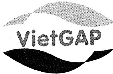
Hình 1. Logo VietGAP trong nuôi trồng thủy sản

- Hình ảnh logo: Bao gồm hình ảnh ngọn sóng cách điệu tạo hình giống như hình ảnh 2 con cá và chữ VietGAP được bao bởi ngọn sóng.