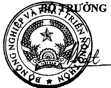
Cao Đức Phát

15.2. Chủ trang trại VietGAP về dê có trách nhiệm phối hợp với các cơ quan có thẩm quyền về giải quyết các vấn đề khiếu nại.